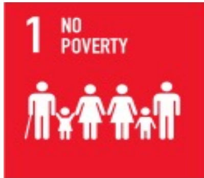
Target 3, 4 dan 5