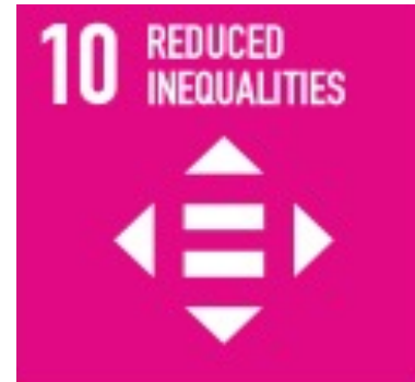
Target 3,4 dan 6